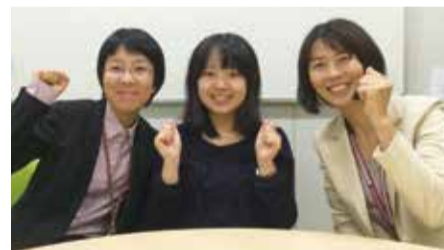
阪急阪神ホールディングス版 日帰り社会貢献見学バスツアー実施決定!